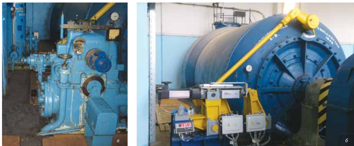
Рис. 3. Система регулирования гидроагрегата №3 Кондопожской ГЭС до модернизации (а) и после модернизации (б)

В качестве исполнительной части системы автоматического регулирования малых ГЭС электропривод показал характеристики не хуже, а где-то и лучше гидропривода. Исключение системы регулирования, использующей масло, сделало невозможным попадание нефтепродуктов в реку. Быстродействие, точность позиционирования и стабильность электропривода на порядок выше характеристик приводов других типов.