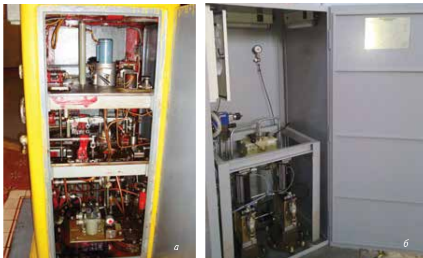
Рис. 2. Колонка управления поворотной турбины до реконструкции (а) и после реконструкции с электроприводом прямого управления главными золотниками НА и РК (б). Нарвская ГЭС

решением компании Emerson на базе ПТК «Овация», которая с 2008 года внедряет на разных ГЭС электроприводы для прямого управления главными золотниками НА и РК, в том числе на объектах ОАО «ТГК-1» в Ленинградской области — Волховской и Нарвской ГЭС (рис. 2).