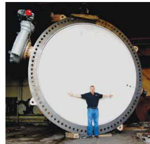
Рис. 1. Электропривод для управления дисковым затвором Bettis, Emerson Process Management

В статье описан практический опыт внедрения электропривода на одной из ГЭС ОАО «ТГК-1».