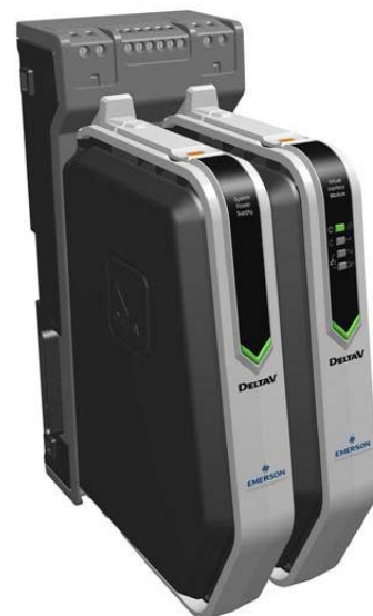
VIM серий S и блок питания

Модульная гибкая компоновка. VIM монтируется таким же образом, как контроллер DeltaV. Он устанавливается в гнездо контроллера 2-слотовой горизонтальной или 4-слотовой вертикальной панели DeltaV и использует стандартный блок питания DeltaV. Усовершенствованная конструкция модулей VIM является гарантией непрерывной эксплуатации в течение нескольких лет.