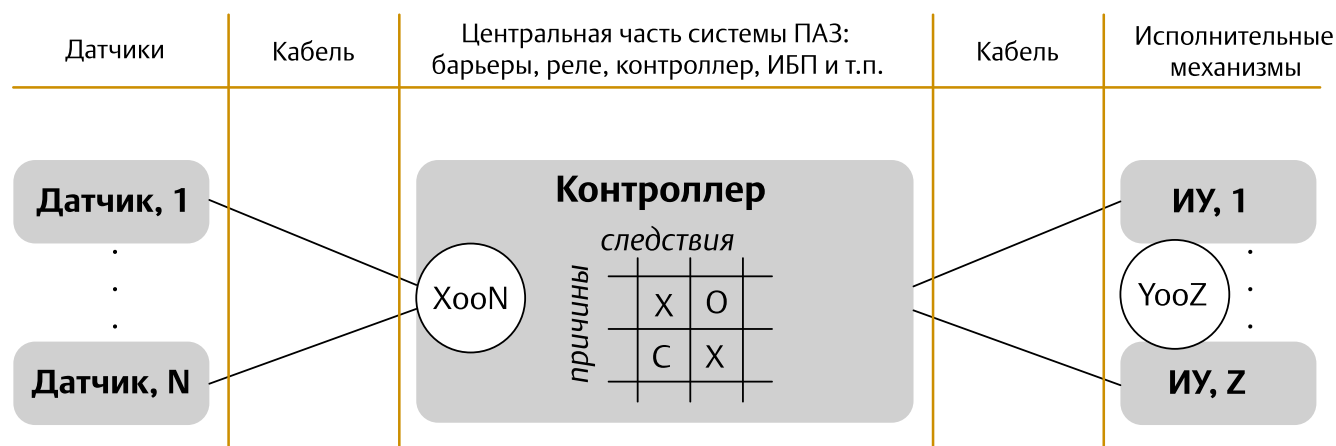
Рис. 3. Пример контура защиты, где X_{00N} — схема голосования X из N входов, для обеспечения блокировки (реализуется в контроллере); Y_{00Z} — схема голосования Y из Z выходов, обеспечения блокировки (определяется установкой исполнительного устройства в «поле»); ИУ — исполнительное устройство (отсечный клапан, насос и т.д.).

Периодично необходимо проводить оценку функциональной безопасности с участием технологов, электриков, специалистов службы КИП и АСУ. Должен быть определен ответственный за соблюдение жизненного цикла функциональной безопасности. Все люди, вовлеченные в стадии жизненного цикла системы ПАЗ, должны быть обучены.