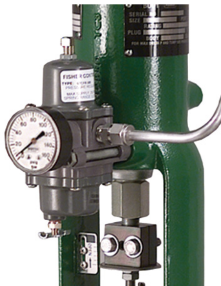
Regulador Tipo 67CFR con dispositivo de purga inteligente montado en un actuador Tipo 667