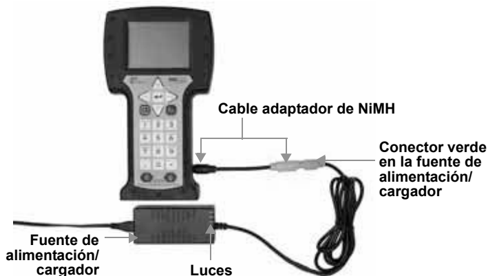
Figura 2. Cable adaptador de NiMH usado para cargar la batería de NiMH

La batería puede recargarse por separado o mientras está conectada al comunicador de campo 375. La luz verde permanente en el cargador/fuente de alimentación indica que la carga se ha finalizado; esto requiere aproximadamente de dos a tres horas. El comunicador de campo 375 funciona totalmente mientras se está cargando.