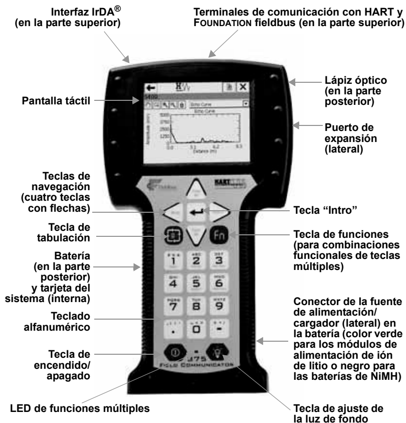
Figura 1. Comunicador de campo 375