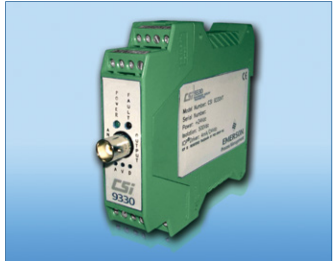
Der CSI 9330 für stationäre Überwachung kritischer Maschinen mit Einbindung in bestehende Anlagen-Überwachungssysteme.