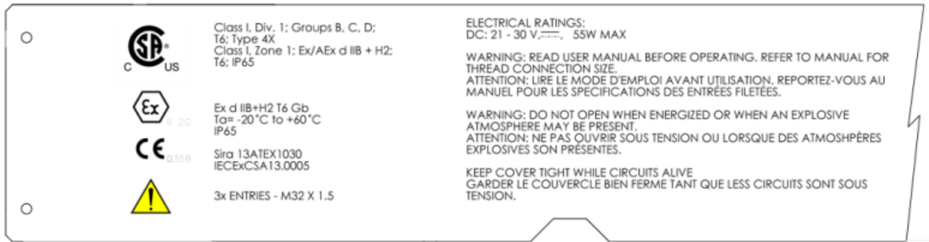
Figure 3. Magnification of the Left Side of the Sample Nameplate / Grossissement du côté gauche du modèle de plaque signalétique