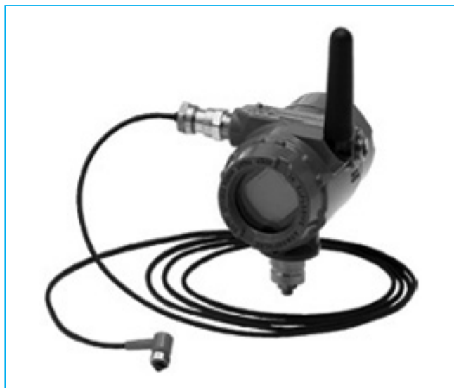
Рис. 1. Датчик вибрации CSI 9420 отправляет данные об оборудовании в интегрированную сеть управления предприятием через беспроводной шлюз. По данным одной нефтеперерабатывающей компании, установка этих полевых устройств занимает пару часов, по сравнению с несколькими днями при установке проводного устройства