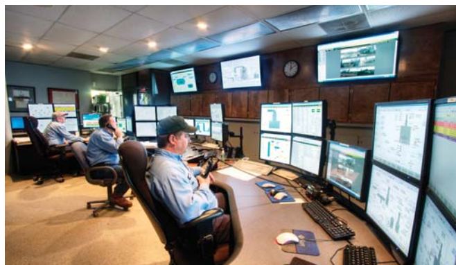
● Рисунок 3. Новая система управления алармами позволяет операторам тратить меньше времени на управление сигнализациями, что дает возможность исследовать и улучшить процесс переработки нефти

Компания Ergon использовала стандартные отчеты в формате Excel для анализа частоты срабатывания алармов и ответных действий операторов. При необходимости дополнительного анализа персонал имел возможность использовать данные непосредственно из отчета Excel. Отчет в формате Excel представляет собой стандартную таблицу, поэтому данные можно без труда использовать так, как потребуется.