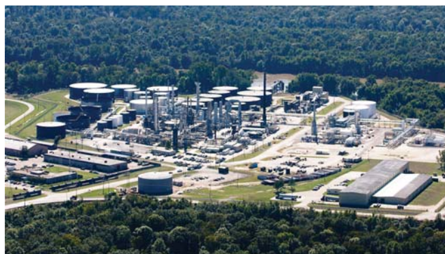
● Рис. 2. Нефтеперерабатывающий завод в г. Висксбурге стал одним из крупнейших производителей нефтяных технологических масел в мире, что обусловило необходимость в эффективном управлении сигнализациями.

Несмотря на то, что сотрудники Emerson были готовы оказать необходимую поддержку при установке системы Analyze, собственный персонал Ergon смог самостоятельно выполнить установку системы без посторонней помощи. Это имеет особое значение, ведь опыт показывает, что осуществлять поддержку системы гораздо проще, если собственный персонал способен самостоятельно выполнить установку и конфигурирование системы.