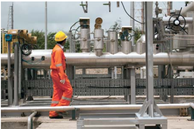
Рис. 4. Узлы учета были установлены на каждом НПЗ на всем протяжении трубопровода

средств коммерческого учета, сертифицированном в соответствии с тремя стандартами ISO. Узлы представляют собой крупные, тяжелые конструкции, которые были доставлены на грузовых морских судах в порты Индии. Оттуда их на грузовиках доставили на место монтажа в точке перехода права собственности. Эти предварительно собранные узлы были доставлены и установлены как интегрированное решение.