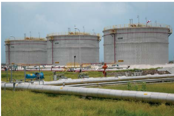
▲ Рис. 2. Терминал Viratgam — один из шести перевалочных пунктов на протяжении трубопровода

Каждый узел включает многолучевые ультразвуковые расходомеры Daniel, измеряющие расход за счет определения разности между временем прохождения ультразвукового импульса по направлению потока и против него, компакт-пруверы и компьютеры расхода S600 Daniel, измерители плотности Micro Motion, датчики давления и температуры Rosemount, регулирующие клапаны Fisher, линии обогрева трубопровода, силовые распределительные щиты и распределительные коробки EGS, а также другие необходимые компоненты. Метод создания 3-D моделей является неотъемлемой частью производственного процесса, что позволяет сократить время реализации таких крупных проектов по созданию инфраструктуры в условиях сжатых графиков проектных работ. Узлы были собраны на предприятии в Сингапуре по производству