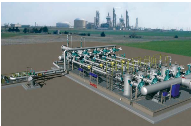
▲ Рис. 3. Программное обеспечение Daniel позволяет создать 3-D модель узла учета

Каждый узел включает многолучевые ультразвуковые расходомеры Daniel, измеряющие расход за счет определения разности между временем прохождения ультразвукового импульса по направлению потока и против него, компакт-пруверы и компьютеры расхода S600 Daniel, измерители плотности Micro Motion, датчики давления и температуры Rosemount, регулирующие клапаны Fisher, линии обогрева трубопровода, силовые распределительные щиты и распределительные коробки EGS, а также другие необходимые компоненты. Метод создания 3-D моделей является неотъемлемой частью производственного процесса, что позволяет сократить время реализации таких крупных проектов по созданию инфраструктуры в условиях сжатых графиков проектных работ. Узлы были собраны на предприятии в Сингапуре по производству