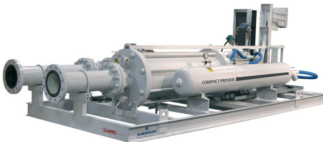
▲ Рис. 5. Каждый узел учета включает модуль, позволяющий вести учет расхода нефти непосредственно на месте в любое время в соответствии с желанием компании Cairn или ее заказчиков

ходомера в реальных условиях эксплуатации в соответствии с требованиями Руководства АНИ по стандартам измерений в нефтяной промышленности.