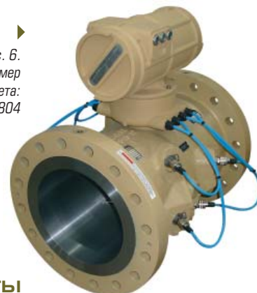
Рис. 6. Ультразвуковой расходомер для коммерческого учета: Daniel 3804

С более чем 80-летним опытом коммерческого измерения расхода мы понимаем, что даже небольшое изменение точности измерений может иметь существенное влияние на прибыльность. Вот почему Daniel стремится снижать погрешности измерений, чтобы помочь предприятиям контролировать расход жидкостей и газов с помощью интеллектуальных расходомеров с расширенной диагностикой, контролирующей все ключевые параметры с помощью интеллектуальных измерительных систем, в которых диагностируются потенциальные сбои до их возникновения, а также поддерживаются нашим сервисным обслуживанием на протяжении всего цикла работы приборов