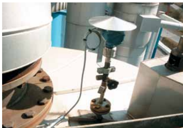
Рис. 3 Сенсор ERS низкого давления, установленный наверху резервуара

Существуют технологические процессы, где необходимо точно отслеживать и контролировать давление газовой подушки в резервуаре. Система ERS позволяет получать данную информацию двумя способами: с помощью хост-системы с поддержкой HART, используя сигналы 4...20 мА с конвертером сигнала TriLoop; и посредством беспроводной связи с применением THUM-преобразователем HART-сигнала.