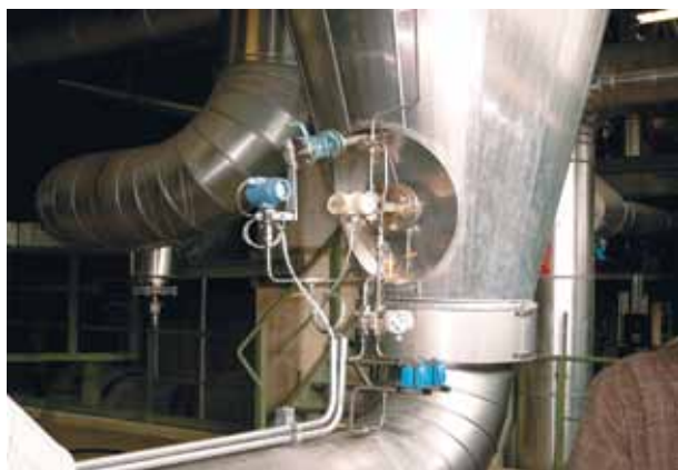
Рис. 2 Сенсор ERS высокого давления, установленный внизу резервуара