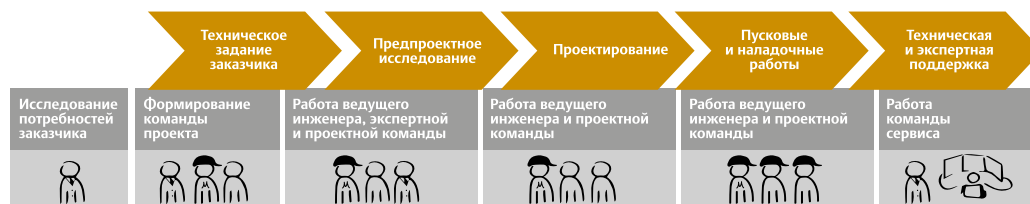
Рис. 2. Последовательность стадий проектирования iOps

В результате сегодня успешно работают уже более