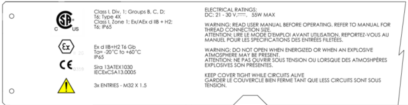
Figure 3. Magnification of the Left Side of the Sample Nameplate / Grossissement du côté gauche du modèle de plaque signalétique