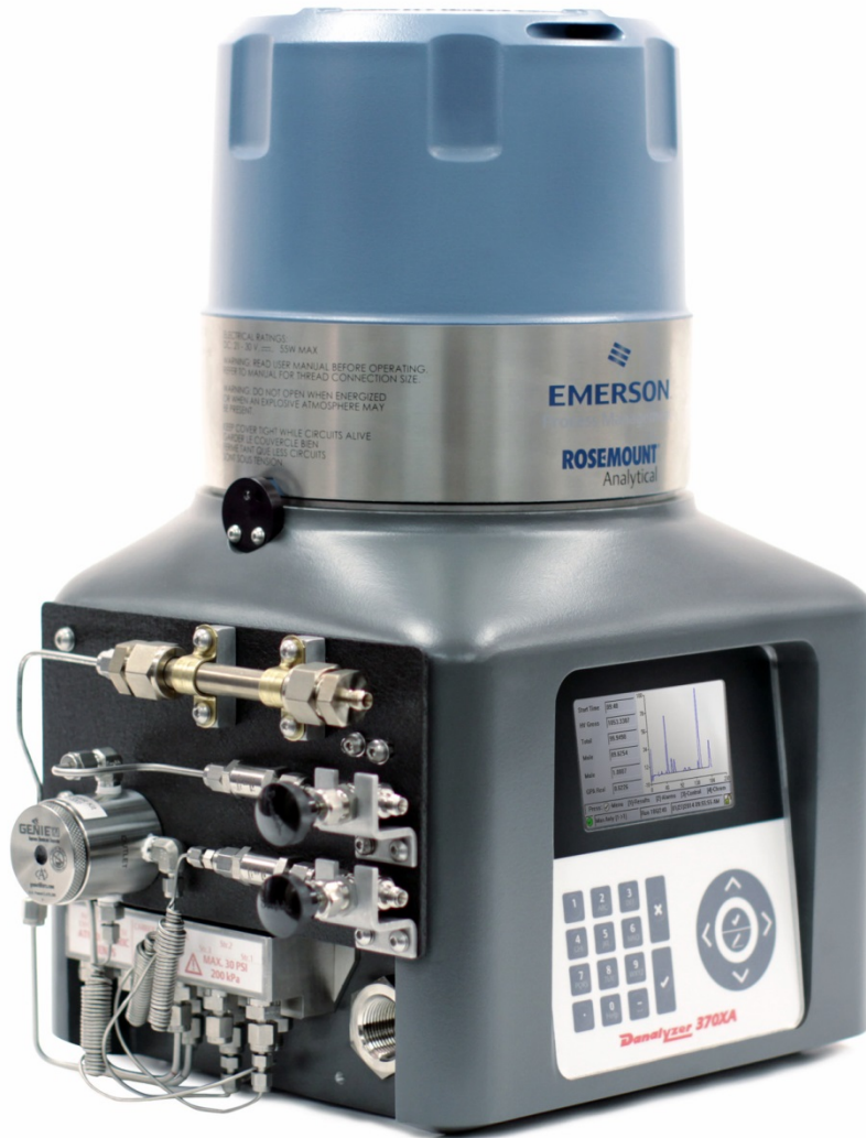
Figure 1. 370XA