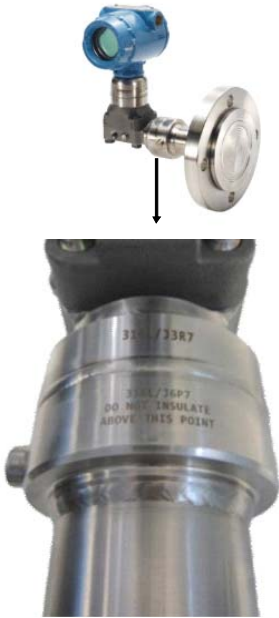
Figura 2. Considerações de isolamento com um sistema expansor de amplitude térmica

O Sistema Expansor de Amplitude Térmica usa o calor do processo para manter ambos os fluidos do sistema a funcionarem adequadamente, pelo que o isolamento nem sempre é necessário. Todavia, é sempre uma melhor prática isolar os sistemas para os manter a funcionar com um óptimo desempenho. O Expansor de Amplitude Térmica nunca deve ser isolado acima da linha marcada na própria vedação, para referência consulte a imagem abaixo.