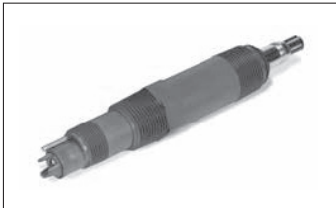
그림 3. 3900VP pH 센서