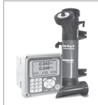
그림 5. T1056 탁도(Turbidity)