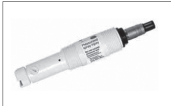
그림 4. 499AOZ 오존(Ozone) 센서