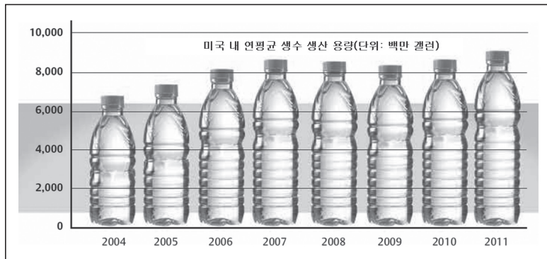
그림 2. 미국 내 연평균 생수 생산 용량