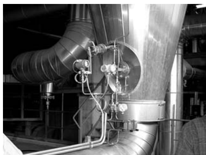
Рис. 2. Сенсор ERS высокого давления, установленный внизу резервуара