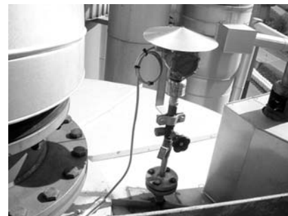
Рис. 3. Сенсор ERS низкого давления, установленный наверху резервуара