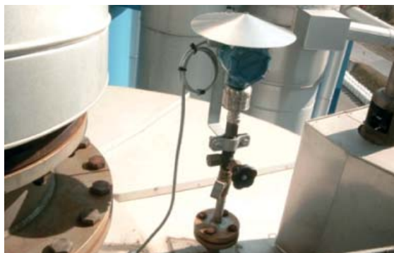
▲ Рис. 3. Сенсор ERS низкого давления, установленный наверху резервуара

Максимальный эффект от использования системы 3051S ERS достигается на ректификационных колоннах, высоких резервуарах и других применениях, например, с длинными переходами и широким диапазоном температур, в таких процессах, как: хранение химреагентов в резервуарах, варка крафт-целлюлозы в котлах, ферментация, реакция алкилирования, брожение пива.