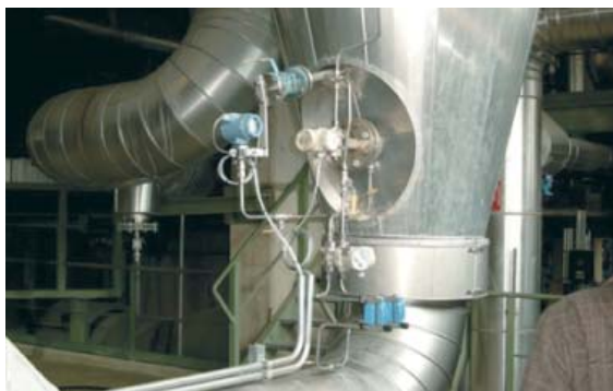
▲ Рис. 2. Сенсор ERS высокого давления, установленный внизу резервуара

Существуют технологические процессы, где необходимо точно отслеживать и контролировать давление газовой подушки в резервуаре, и благодаря системе ERS можно получить данную информацию с помощью хост-системы с поддержкой HART, используя сигналы 4-20 мА с конвертером сигнала Tri-loop или посредством беспроводной связи с THUM-преобразователем (сигнала HART в беспроводной) (рис. 2, 3).