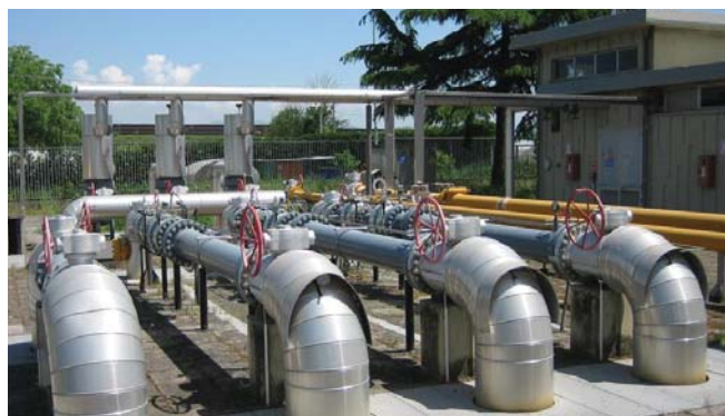
L'impianto REMI Toscana Energia dopo le modifiche - Regolatori di pressione FL DN 150 a flusso assiale con silenzianti SRS integrati - senza pannelli e coibentazione tubazioni fonoassorbenti