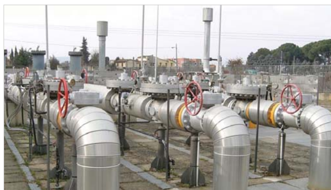
L'impianto REMI Toscana Energia prima delle modifiche - Regolatori di pressione DN 150 a flusso avviato senza silenzianti integrati - con pannelli e coibentazione tubazioni fonoassorbenti

Ing. Marcello Rubino Responsabile Distribuzione Toscana Energia S.p.A.