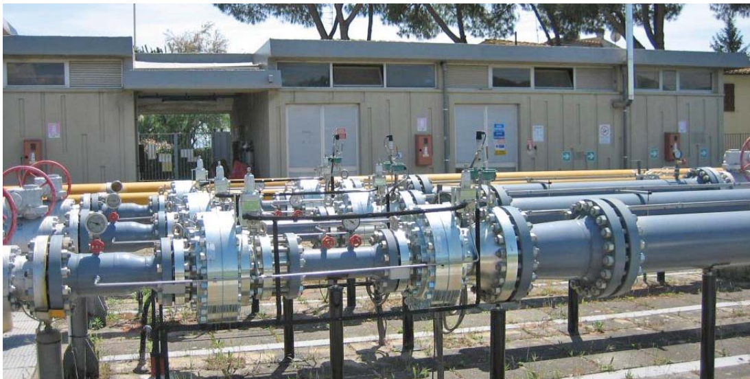
I regolatori "Monitor" FL e regolatori "Attivi" FL/SRS DN 150 installati sulle tre linee dell'impianto REMI di Firenze-Ugnano di Toscana Energia

Grazie a questi benefici Toscana Energia ha quindi scelto di utilizzare la soluzione FL/SRS su un altro impianto REMI dove stavano affrontando le medesime problematiche.