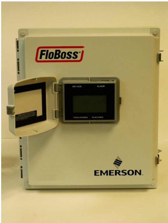
Figure 1 W40184