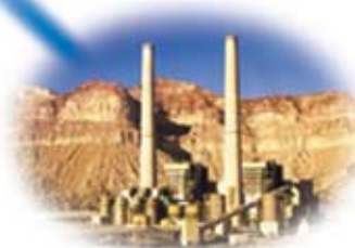
Impianto a carbone