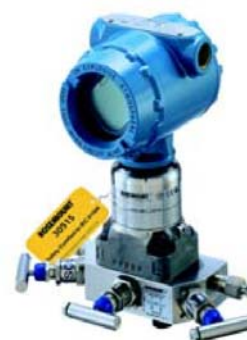
经过安全认证的罗斯蒙特压力变送器 3051S 用于炉用燃料安全停车系统 (2oo3 冗余)