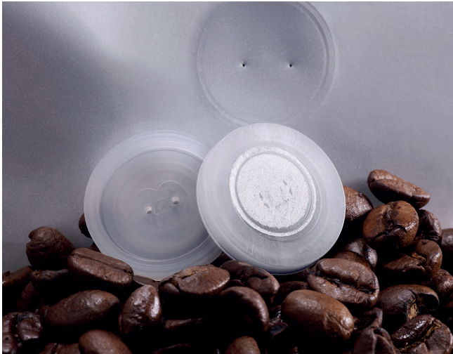
Mit Aromaschutzventil: Das Ventil Bosch VIS wird mittels Ultraschall mit der Verpackungsfolie verbunden. Das Ventil ermöglicht das Entgasen und verhindert gleichzeitig das Einströmen von schädlichem Sauerstoff