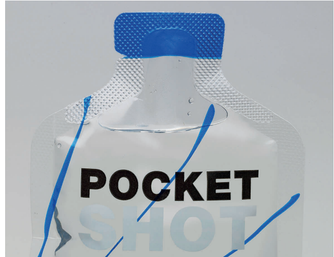
Ultraschallgeschweißte Dichtungen gewährleisten die Unversehrtheit von Pocket Shot, einem dreischichtigen 50-ml-Folienbeutel für verschiedene Getränke. Pocket Shot ist eine robuste Alternative zu Kunststoffflaschen für unterwegs

schen Polymers enthalten. Anstelle herkömmlicher Polymere enthalten sie in der Regel mindestens 20 % an biobasierten Materialien, um die biologische Abbaubarkeit oder Kompostierbarkeit zu verbessern. Zweitens bieten herkömmliche Heißsiegelgeräte, die zur Herstellung vieler Verpackungen der aktuellen Generation verwendet werden, nur einfache Steuerungsmöglichkeiten wie Zeit, Temperatur und Druck. Folglich können sie nicht die empfindliche Prozesssteuerung bereitstellen, die für die zuverlässige Abdichtung von Biopolymer-Werkstoffen erforderlich ist. Aus diesem Grund bieten immer mehr Maschinenbauer eine andere Möglichkeit zur Herstellung und Versiegelung von Verpackungen an, und immer mehr Hersteller und Verpacker ziehen diese in Betracht: die Ultraschallschweißtechnik.