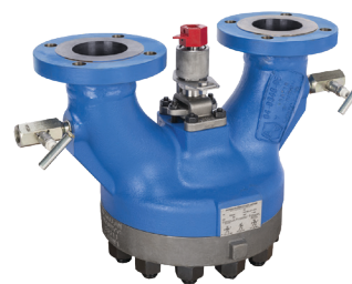
Устройство переключения предохранительных клапанов (ПУ) Anderson Greenwood

Emerson Automation Solutions Россия, 115054, г. Москва, ул. Дубининская, 53, стр. 5 Телефон: +7 (495) 995-95-59 Факс: +7 (495) 424-88-50 Info.Ru@Emerson.com www.emerson.ru/automation