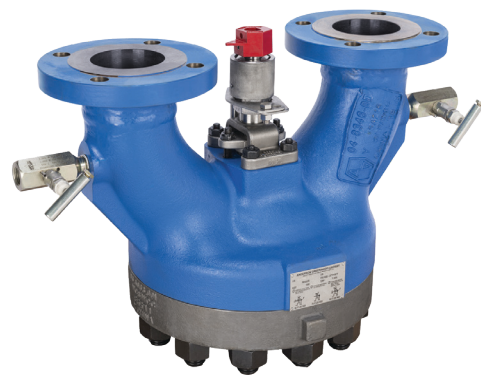
Устройство переключения предохранительных клапанов (ПУ) Anderson Greenwood

Незапланированная остановка критически важных технологических процессов может быть чрезвычайно дорогой. ПУ обеспечивает альтернативу отключениям, вызванным неисправностями предохранительного клапана. Просто переключитесь на запасной клапан, не прерывая технологический процесс, и устраните неисправность во время следующего планового ремонта.